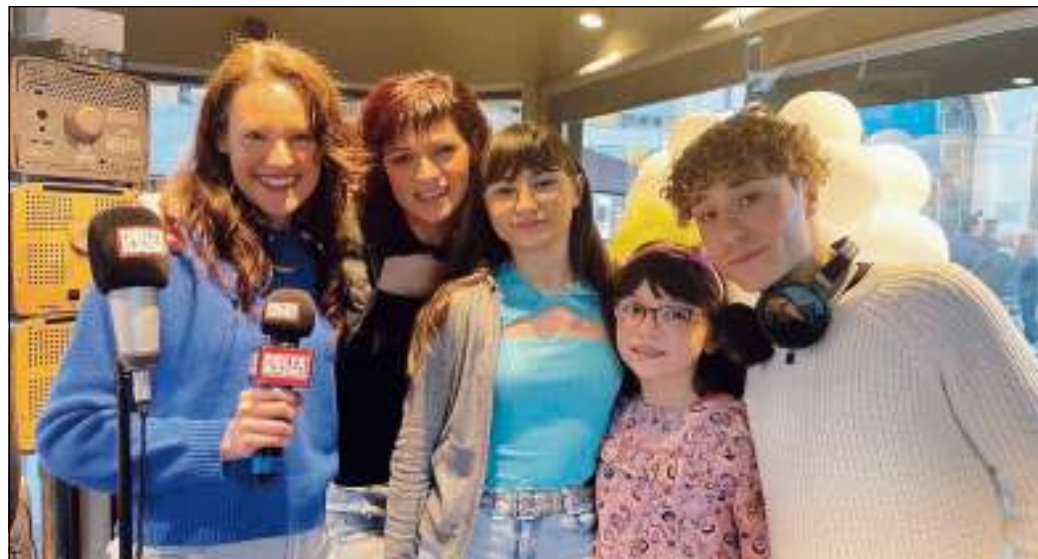
que, per celebrare l'arrivo della primavera e godersi un weekend all'insegna del divertimento e del relax, immersi nella vivacità del centro storico di Rovigo.