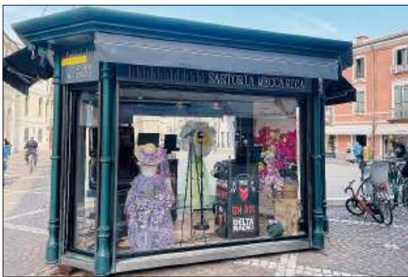
Il Delta Radio Box Live allestito ad hoc con le creazioni floreali di Fiorissimi Group