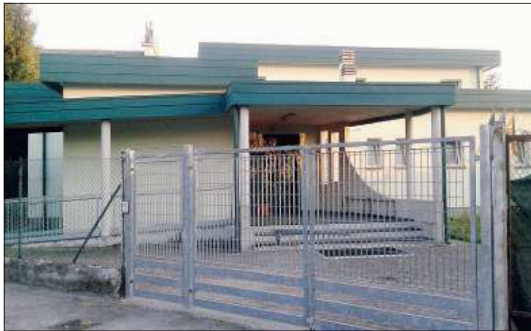
Approva il progetto per i lavori di riqualificazione energetica dell'ex scuola elementare

LUSIA - Il Comune di Lusia, in delibera di Giunta, approva il progetto di fattibilità tecnica ed economica per dei lavori di riqualificazione energetica per l'edificio dell'ex scuola elementare di Cavazzana, oggi centro aggregativo Ada Negri, per richiedere finanziamenti al 100% del capitale per la sostituzione della caldaia e la costruzione di un impianto fotovoltaico. Nel mese di marzo, la Giunta comunale di Lusia ha approvato un progetto di sostenibilità ed efficienza energetica del valore complessivo pari a poco più di 8mila euro al fine di procedere alla richiesta di finanziamento ministeriale in conto capitale del 100% per la sostituzione del generatore termico e la realizzazione di un impianto fotovoltaico nella ex scuola elementare di Cavazzana. "Ci sono dei fondi ministeriali a disposizione quindi abbiamo approntato un progetto per cercare di sostit-