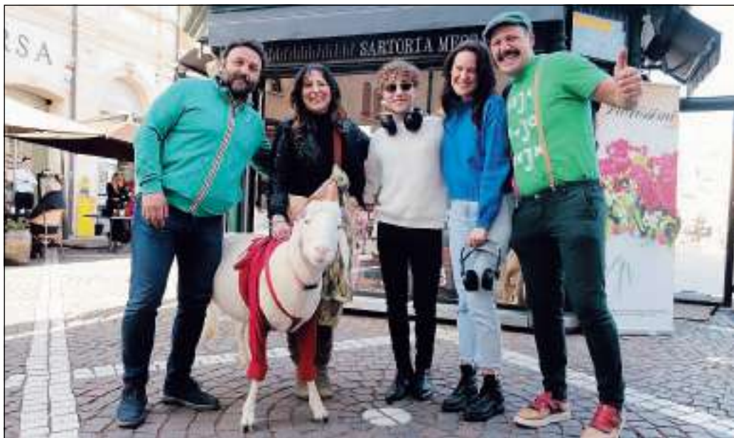
Il Delta box live in piazza Garibaldi