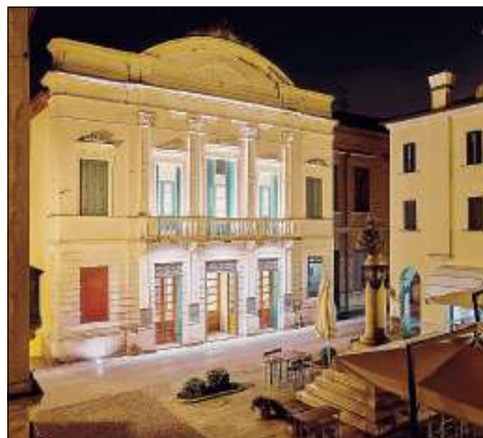
Un evento teatrale di solidarietà e sensibilizzazione