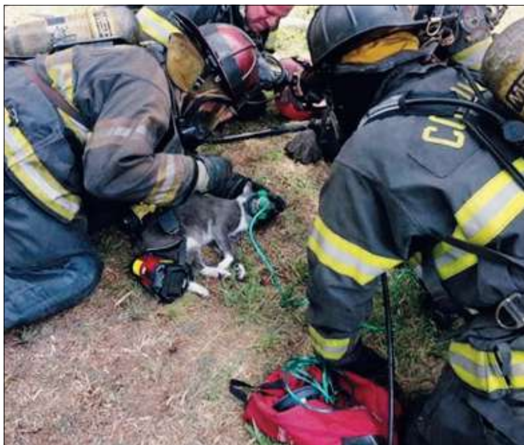
Intervento lampo per salvare i tre micetti

hanno scatenato le fiamme, partite dalla cucina, che non era in funzione dal momento che era notte e in casa