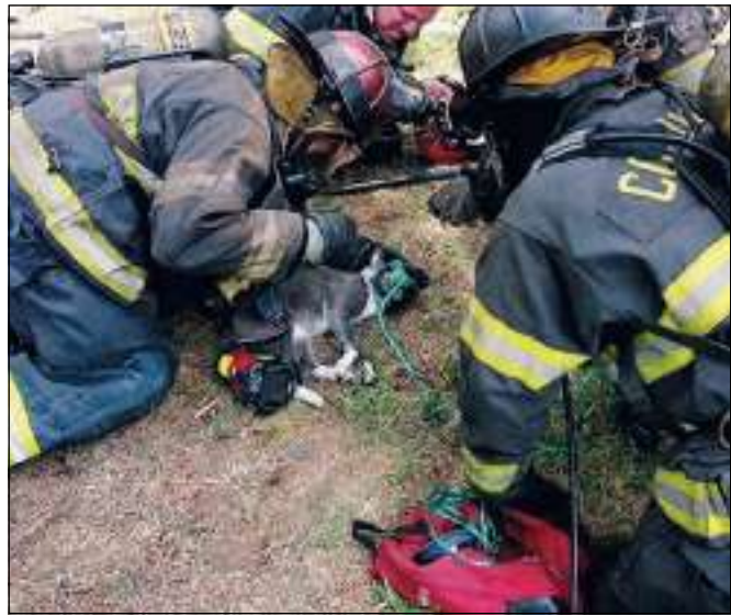
I pompieri sono intervenuti ma per i gatti non c'è stato niente da fare