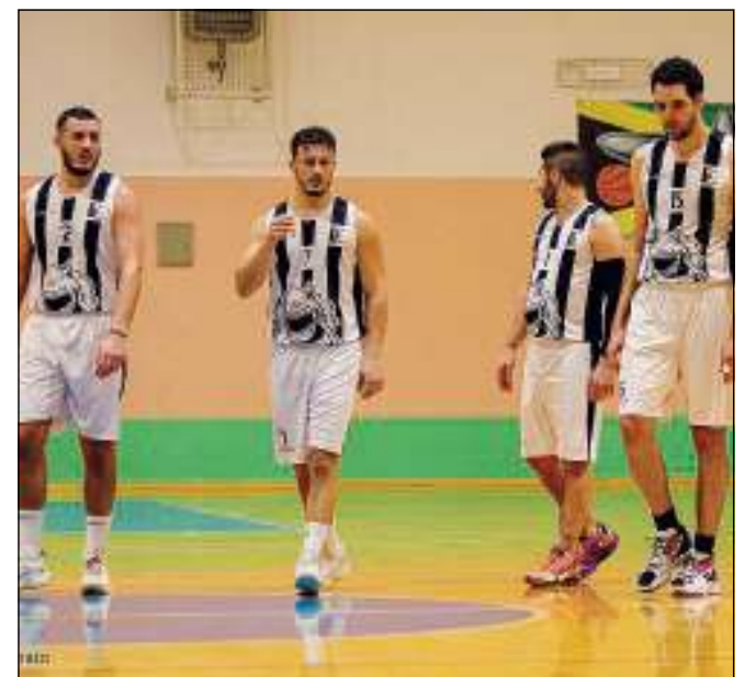
La matematica conferma i playoff per la Cipriani Nbr

Note: (parziali 21-20, 33-37, 47-48, 64-62)