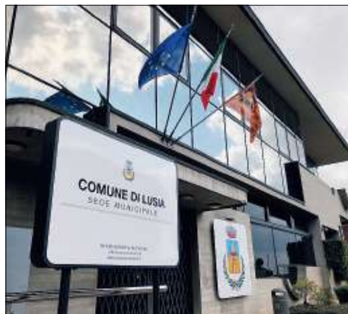
Grazie ad un bando della Fondazione Cariparo