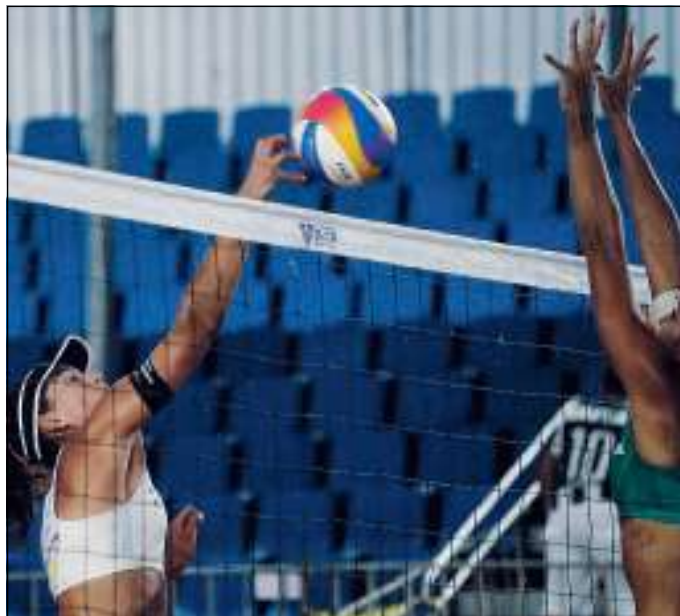
La coppia azzurra stacca il pass per i quarti di finale

BASKET L'obiettivo è quello di chiudere la regular in bellezza