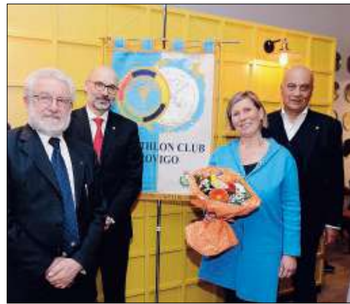
Il Panathlon premierà il Porto Viro