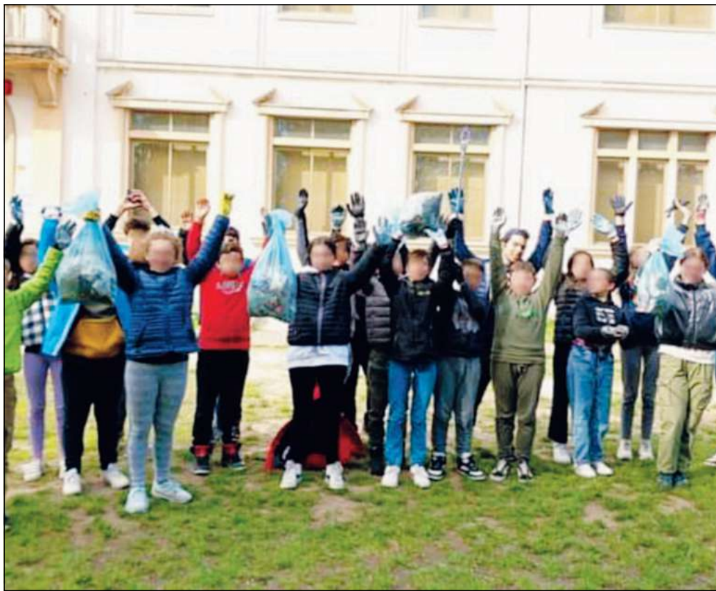
Grande e importante iniziativa di sensibilizzazione sul tema dell'inquinamento