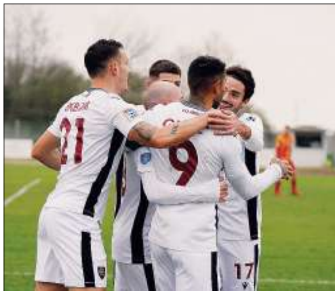
Adriese a caccia della prima vittoria in casa del 2023

ROVIGO -L'Adriese, oggi alle 15, andrà ancora a caccia della prima vittoria al "Bettinazzi" in campionato del 2023, ospitando la Virtus Bolzano nella 31esima e quart'ultima giornata, la prima del rush finale che dirà finalmente il nome della "prescelta" nella lotta serrata alla conquista della Serie C. Una caccia che, se dovesse finalmente portare buoni frutti, potrebbe persino profumare lontanamente di vetta, alla luce della partita difficilissima che attende il Legnago capolista - in casa del Cjarlins Muzane - che gode di 4 punti di vantaggio sui granata terzi in classifica. Ma, come detto, gli uomini di Roberto Vecchiato, reduci da 4 risultati utili, non avranno alternative alla vittoria per sperare nella rimonta, nel tentativo di rompere l'incantesimo che per quasi 4 mesi li sta privando dei tre punti davanti al proprio pubblico (5 pari e 2 ko nelle 7 gare interne giocate in campionato nel 2023). E,