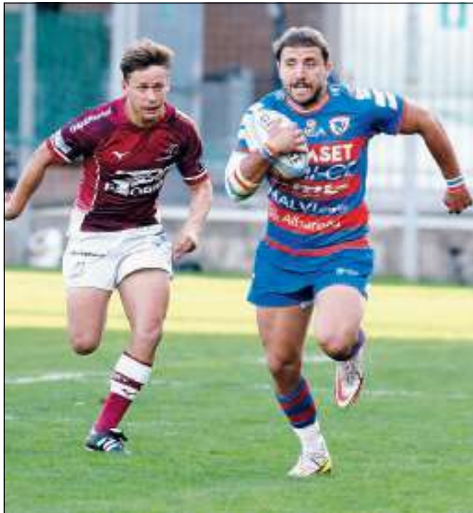
Femi Cz impegnata in trasferta a Mogliano Veneto