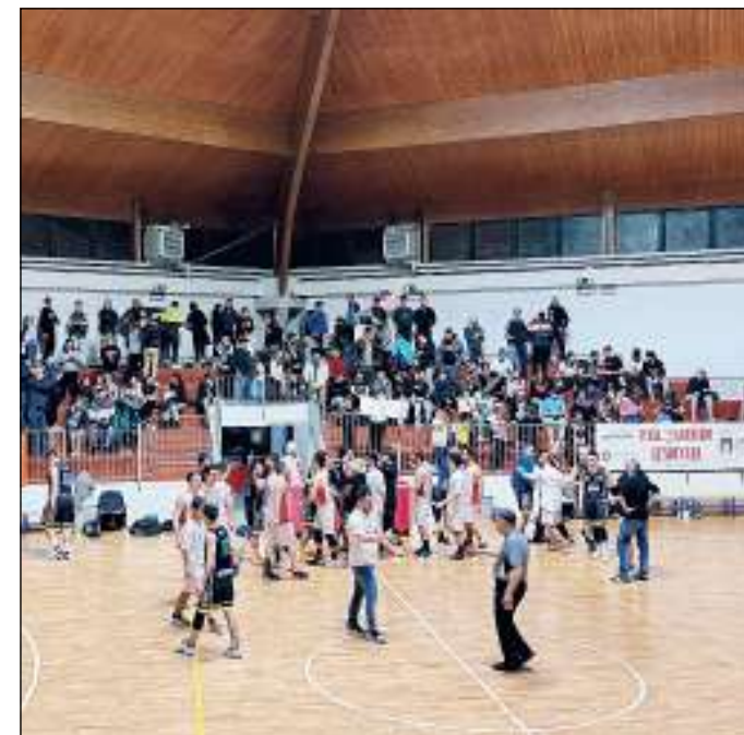
Pallacanestro Lendinara, blindato il secondo posto